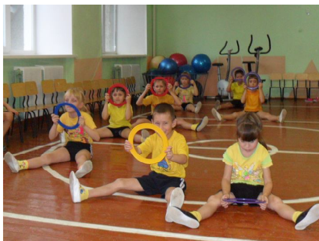
СПОРТ! СПОРТ! СПОРТ!