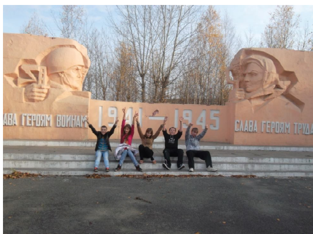
СЫГРАЕМ В ЧЕК-ПОИНТ?