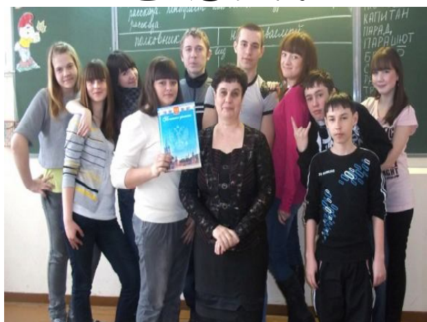
МЫ- 10 КЛАСС!