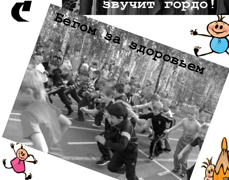
Бегом за здоровьем