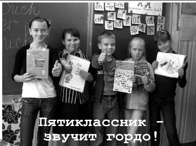
Пятиклассник - звучит гордо!